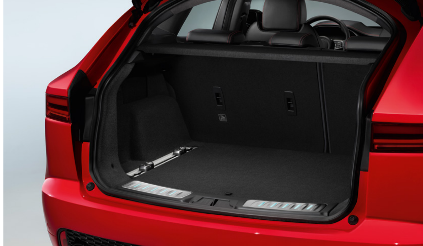
Finisaj pentru compartimentul de bagaje - Iluminat

Sistemul de finisare a compartimentului pentru bagaje îmbunătățește zona compartimentului pentru bagaje și protejează buza la încărcare sau descărcare. Fabricat din oțel inoxidabil, cu un finisaj „periat”, lucios, acesta se aprinde atunci când compartimentul de bagaje este deschis și asigură o finisare premium a zonei compartimentului pentru bagaje.