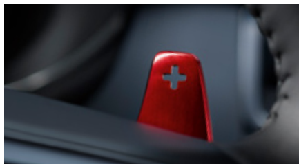
Padele pentru schimbarea vitezelor - aluminiu roșu

Padelele de schimb pentru schimbarea vitezelor de pe volan, din aluminiu premium, oferă un finisaj de înaltă calitate contactului cheii.