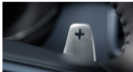
Padele pentru schimbarea vitezelor - aluminiu

Padelele de schimb pentru schimbarea vitezelor de pe volan, din aluminiu premium, oferă un finisaj de înaltă calitate contactului cheii.