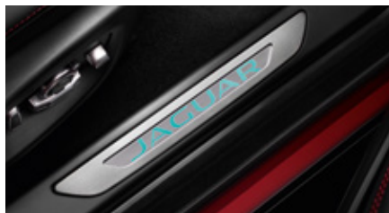
Ornamente de prag - iluminate

Ornament de prag cu finisaj elegant și stilat, din oțel inoxidabil pentru portierele șoferului și pasagerilor, cu caracter britanic distinctiv.