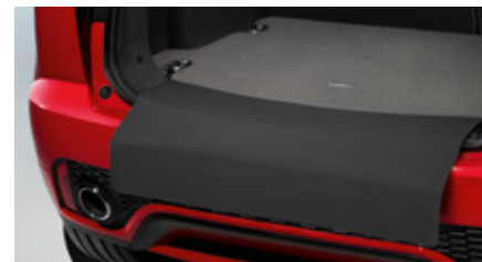
Covoraș de lux pentru compartimentul de bagaje cu protecție pentru bara de protecție Covoraș de lux, moale pentru bagaje, cu logo-ul Jaguar. Plus cu adâncime de 2,050 gm 2 , premium, cu margini din piele nabuc.