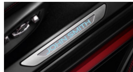
Ornamente de prag - iluminate ersonalizate

Ornament de prag cu finisaj elegant și stilat, din oțel inoxidabil pentru portierele șoferului și pasagerilor. Luminează atunci când se deschide fie portiera șoferului, fie portiera pasagerului. Sunt scoase în evidență de lumina albastru fosfor.