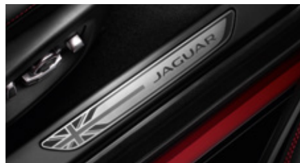
Ornamente de prag - Union Jack

Ornament de prag cu finisaj elegant și stilat, din oțel inoxidabil pentru portierele șoferului și pasagerilor, cu caracter britanic distinctiv.